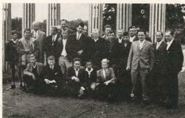
Spelare och ledare samlade under en utflykt vid östtyska gränsen.

en stor upplevelse. Vi anlände till Lübeck den 17 augusti efter en trevlig resa som gått från Malmö via Köpenhamn—Gedser. På lördagen hade våra värdar anordnat en utflykt, som företogs i privatbilar. Vi fick bl.a. besöka gränsen mellan Öst- och Väst-Tyskland. Vidare gjordes ett uppehåll på den berömda badorten Trawemünde.