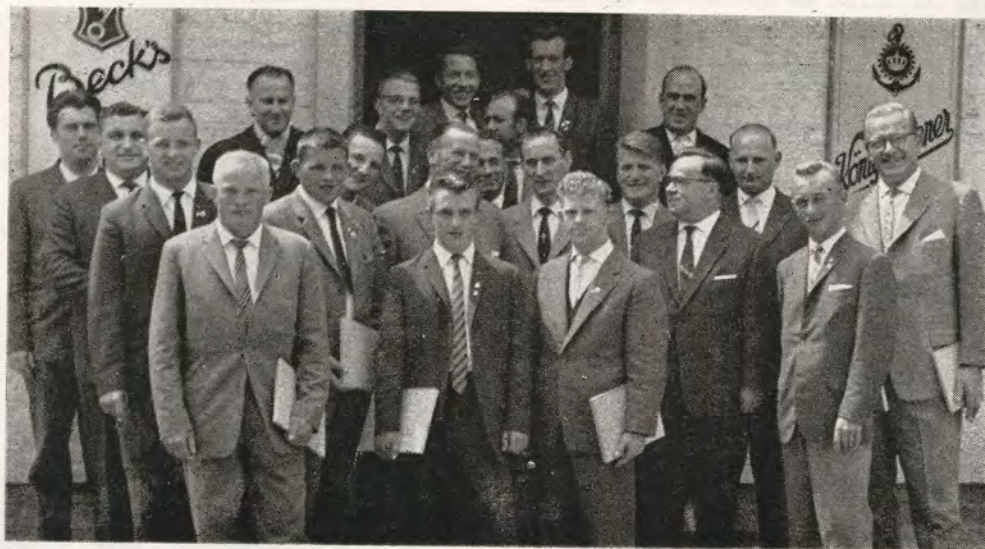
Från brottarnas utlandsturné: Gäster och värdar vid en mottagning i Alsdorf, en förstad till Aachen.

Brottningsbredden gjorde sig också gällande i årets fyrstadstävling. A-laget gjorde sin 18:e start i B-gruppen i Arboga. I A-gruppen har vi varit 8 gånger och i C-gruppen 5.