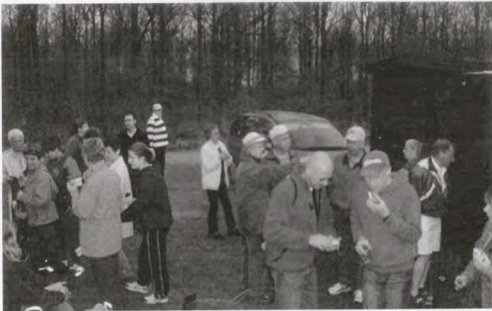
Det smakar gott med en grillad med bröd efter en härlig vårpromenad

Eftersom intresset var så stort kan vi förhoppningsvis ordna något liknande våren 2007!