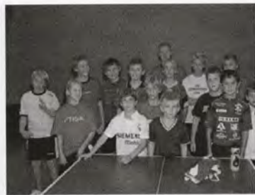
Ungdomar från vår ungdomsverksamhet