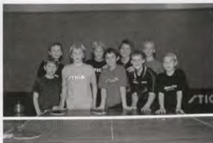
Delar av tävlingsgruppen