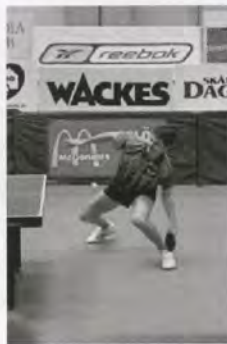
Från Champions League hemma. Här är det Timo Boll som är i farten.

Skulle Ni vilja fördjupa Er i vår verksamhet, besök då gärna vår hemsida: www.eai.se/bordtennis