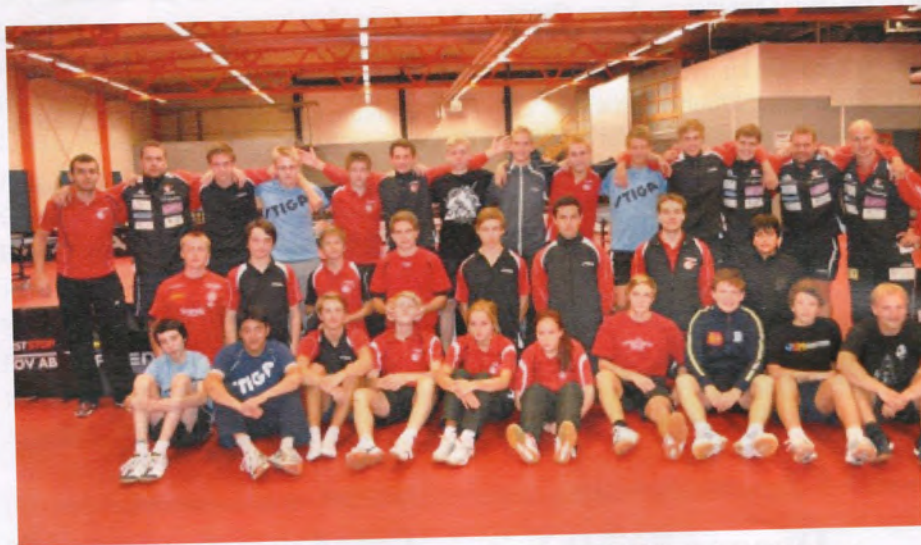
Vårt bordtennisgymnasium, elitlaget samt klubbens huvudtränare