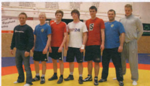
En träningskväll med seniorerna.