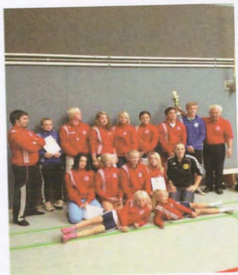
EAI i Tyskland