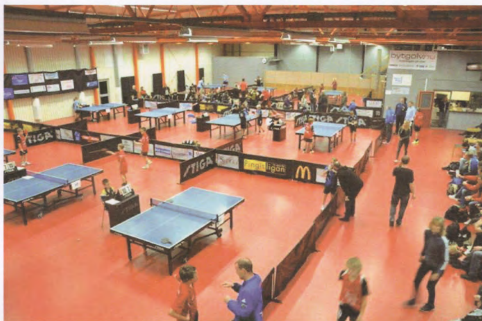
Ungdomsmatcher i Blomsterbergshallen