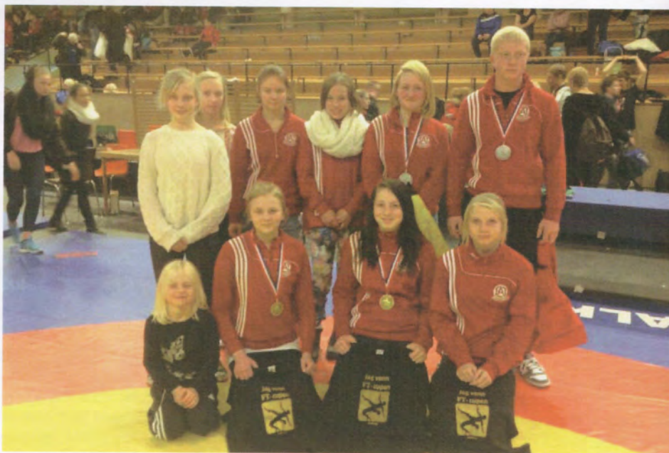
Brottarna på FT-Cupen