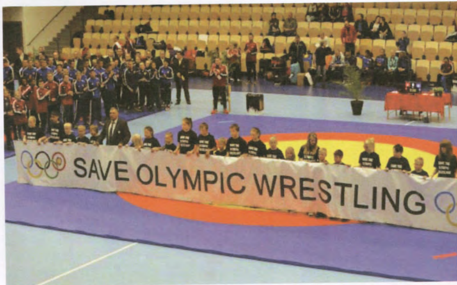
Save the olympic wrestling uppvisning vid NM i Eslövshallen