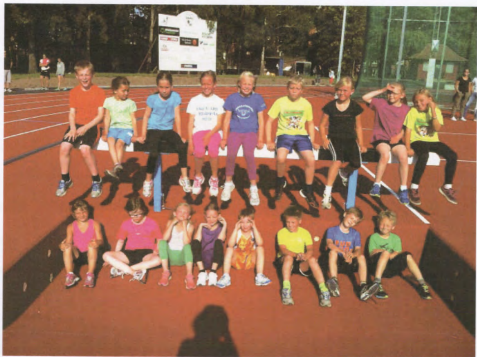
Glada ungdomar på nyrenoverade Ekevalla Idrottsplats