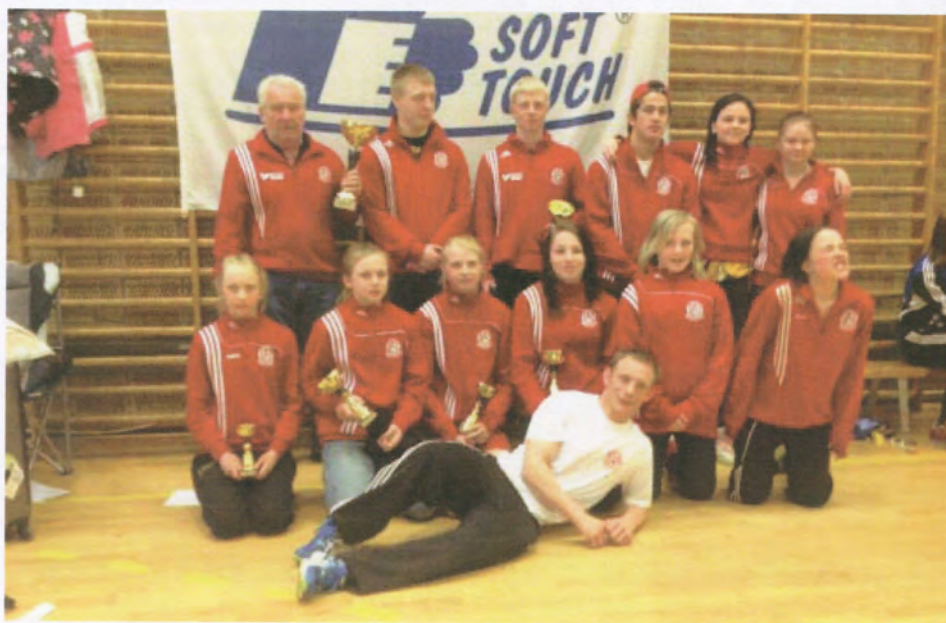
Soft Touch i Göteborg