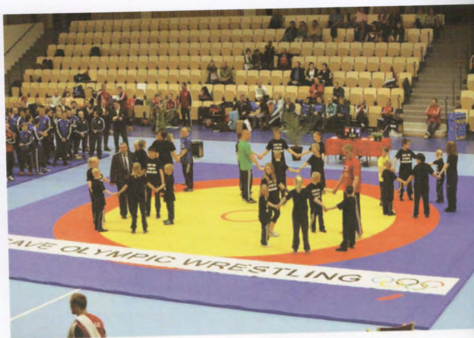
NM i Eslövshallen