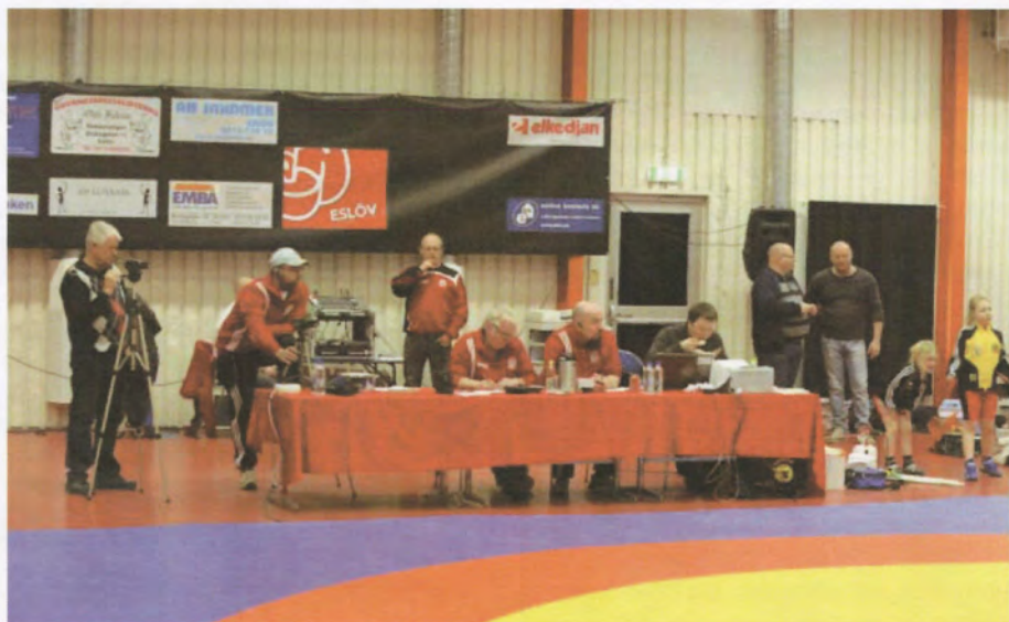
Nybörjartävling på hemmaplan mars 2013