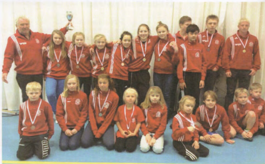
EWC på hemmaplan januari 2013