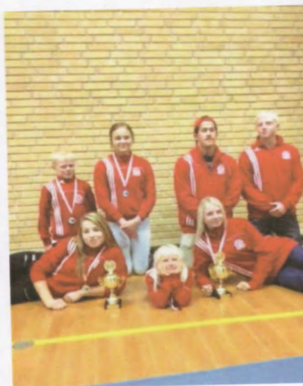
EAI i Danmark