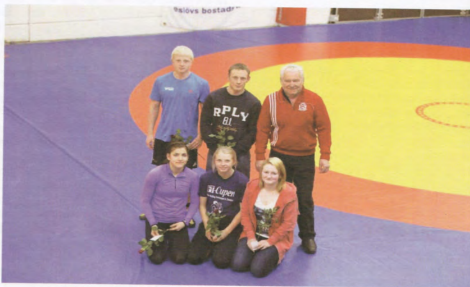
Firande av SM-medaljer