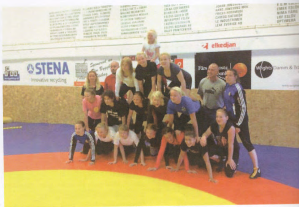
Landslagsläger i Eslöv